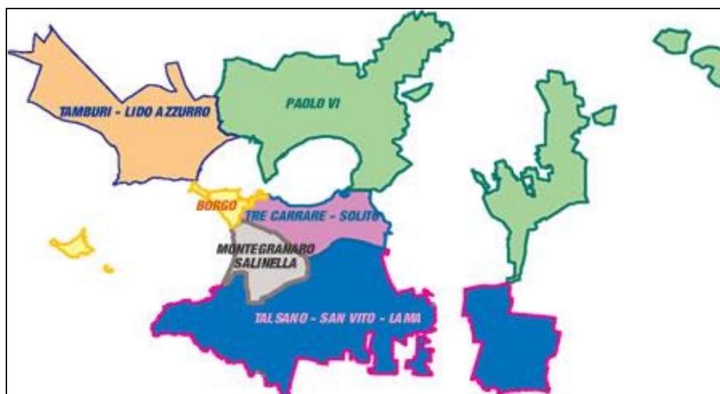
Figura 2 - Confini delle circoscrizioni del Comune di Taranto